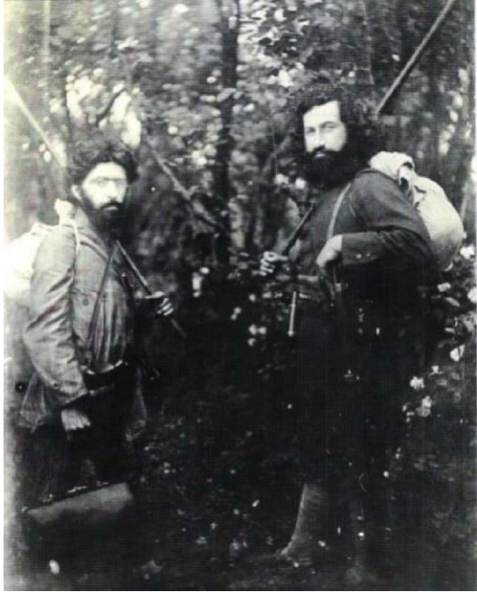
میرزا کوچک خان جنگلی و دکتر ابراهیم حشمت